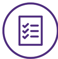
Gestion des risques et qualité